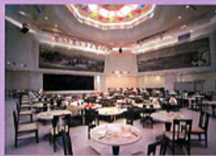
中国料理 陽明殿 (B1)