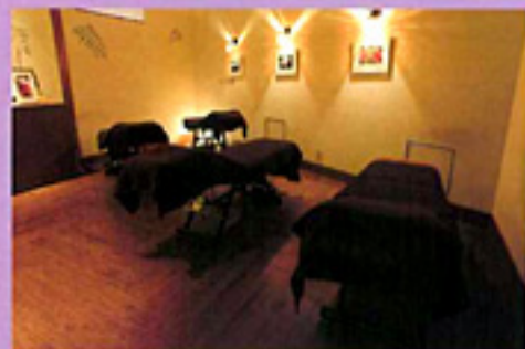
ル・タン ラグジュアリー (B2)

コースの中のおすすめ【鳥骨鶏とフカヒレの蒸しスープ】は食欲増進によりエネルギーの補給が適い、気力を益して強い体力と美肌を生み出す基が出来上がります。利水の効果で水分代謝も促進、腫れやムクミの解消にもつながります。