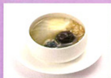
鳥骨鶏とフカヒレの蒸しスープ

コースの中のおすすめ【鳥骨鶏とフカヒレの蒸しスープ】は食欲増進によりエネルギーの補給が適い、気力を益して強い体力と美肌を生み出す基が出来上がります。利水の効果で水分代謝も促進、腫れやムクミの解消にもつながります。